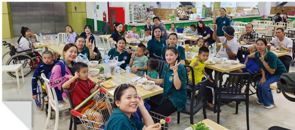
라오스 비엔티엔 농아특수학교, 요조센터, KOICA 청년중기봉사단(장애·인권) 파견사업(2024~2026)